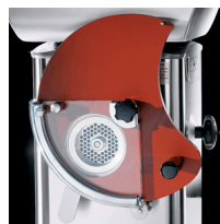
Optional patty former