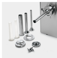
Optional stuffer kit