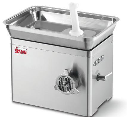
Sirman Мясорубки , model TC 22 Nevada :

Sirman Spa Viale dell'Industria 9/11 35010 PIEVE DI CURTAROLO (PD), Italy Tel./Fax. +39 049 9698666 / +39 049 9698688 email: info@sirman.com