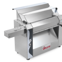
Sansone 42 with optional pasta cutter