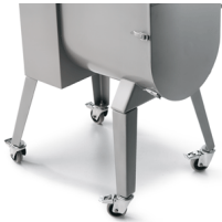
Optional legs with wheels