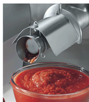
Optional tomate sauce making